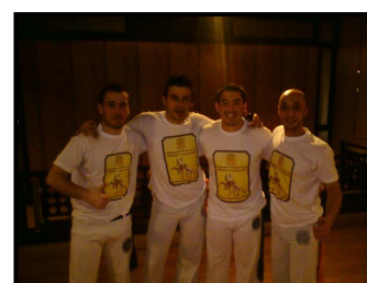
Graduado Guerreiro, Lobinho, graduado Toco e Monitor Aranha.