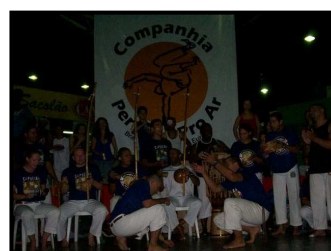
Formatura CM Boca de Peixe - Brasil 2007