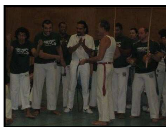
Formatura CM Porquinho - Alemanha 2005