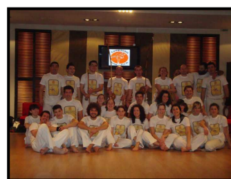
Alunos CPPA Ioannina e graduados convidados